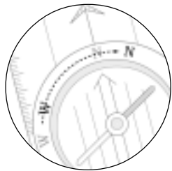
Réglage de l'angle de déclinaison