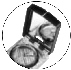
Miroir de visée

D es boussoles de style traditionnel aux systèmes satellites sophistiqués, les explorateurs d'aujourd'hui ont l'embaras du choix lorsque vient le temps de se procurer un instrument d'orientation. Voici un aperçu des différents appareils offerts et de leurs caractéristiques.